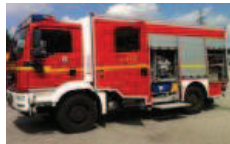
LF 20 KatS